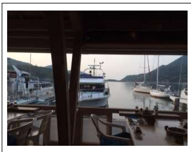
鶴丸レストランからの眺め